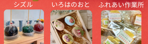
★ グッドフェローズ たけちゃん農園