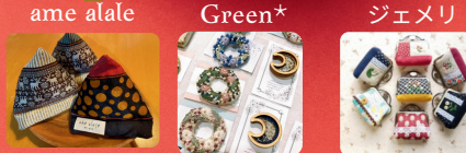
ame alale Green* ジェメリ