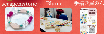
seragemstone Blume 手描き屋のん