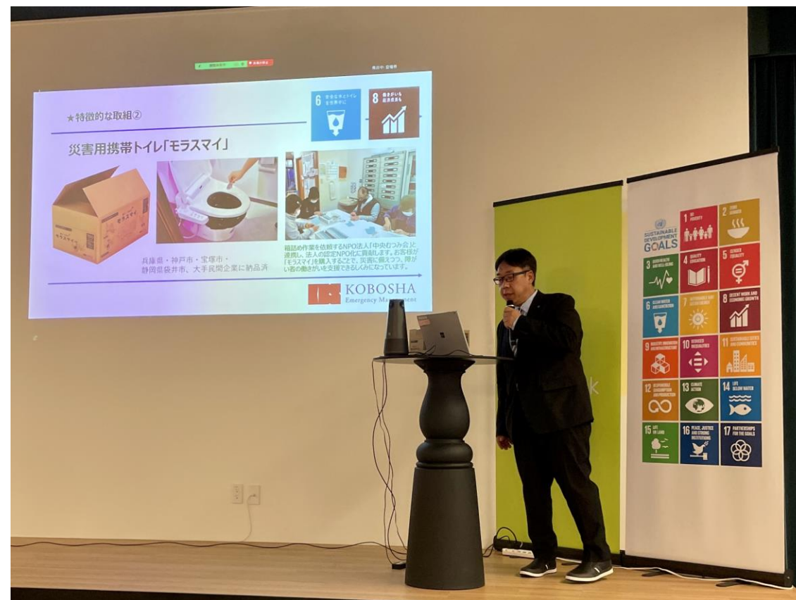
⑥「ひょうご産業SDGs認証事業」の申込企業募集 -県地域経済課、(株)神防社

女性だけのメンテナンスチームの発足や育休等の働く環境の改善により、男女ともに働きやすい会社となるよう取り組みを実施している。