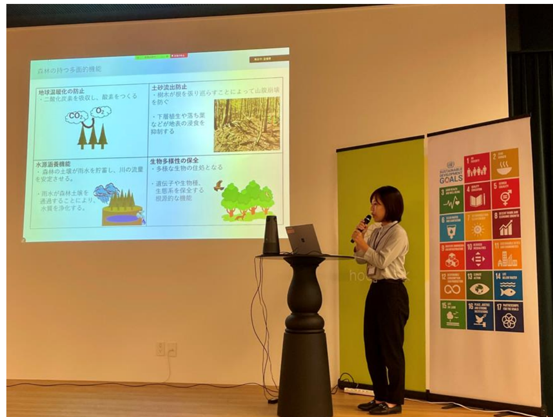
④県産木材の利用に関する補助金等の申込企業募集 -県林務課

社家郷山では木を切ることで太陽の光を森の奥まで届け、多様な植物や生き物が育つ豊かな森を目指している。今後さらに活動を広げられるよう情報発信をしていきたい。