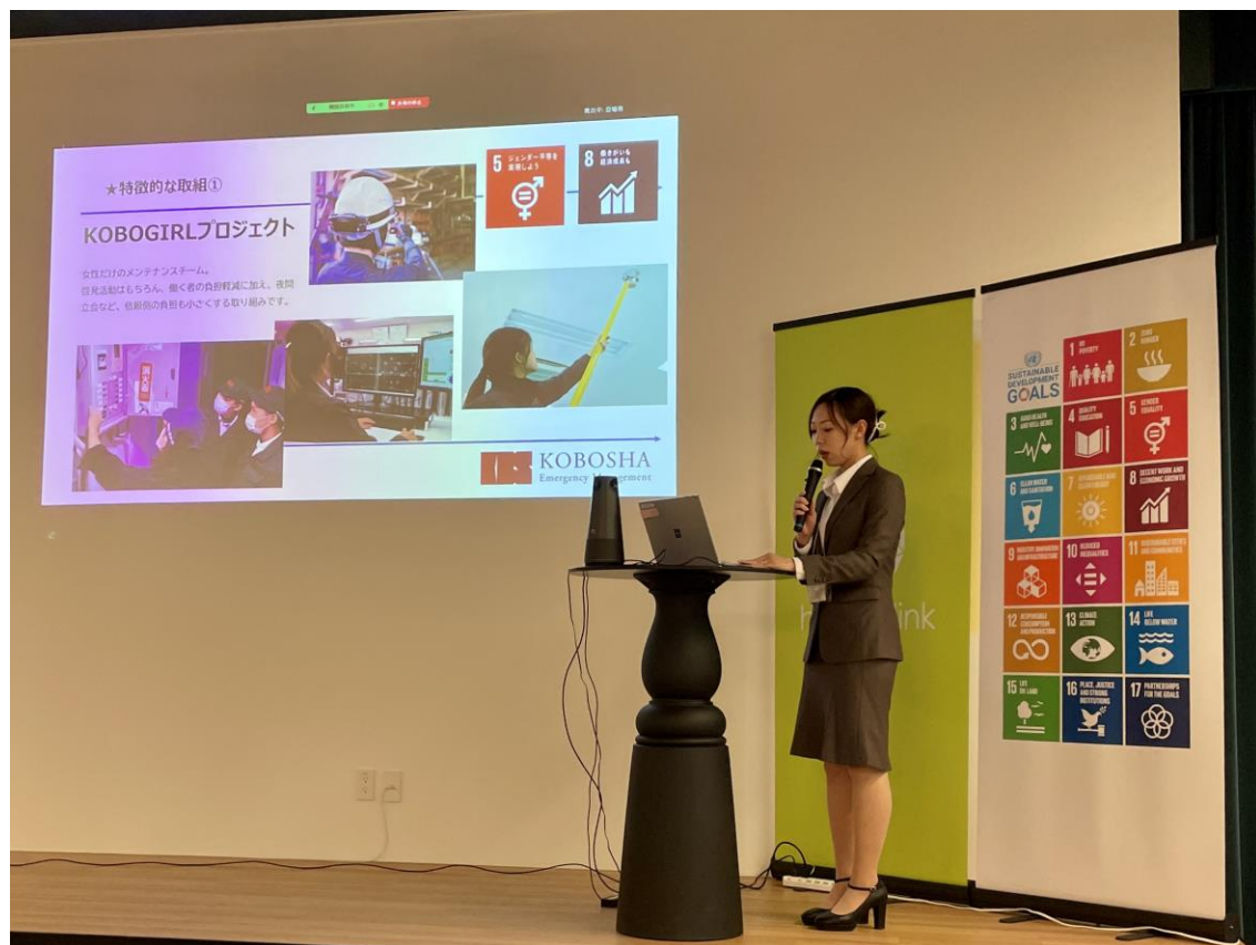
⑥「ひょうご産業SDGs認証事業」の申込企業募集 -県地域経済課、(株)神防社

女性だけのメンテナンスチームの発足や育休等の働く環境の改善により、男女ともに働きやすい会社となるよう取り組みを実施している。