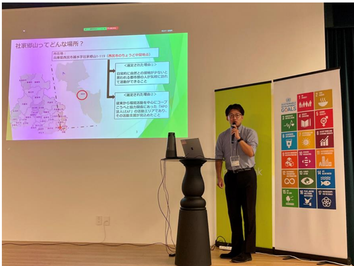
③「企業の森づくり」の参画企業募集 -県治山課、生活協同組合コープこうべ

社家郷山では木を切ることで太陽の光を森の奥まで届け、多様な植物や生き物が育つ豊かな森を目指している。今後さらに活動を広げられるよう情報発信をしていきたい。