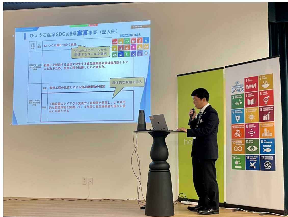
⑥「ひょうご産業SDGs認証事業」の申込企業募集 - 県地域経済課 、(株)神防社

カーボンニュートラルの実現に向けて、中小事業者に対しての段階に応じた支援や県民の脱炭素型ライフスタイルへの転換を後押しする普及啓発活動を実施している。