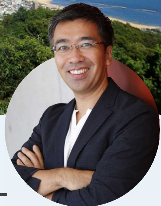
慶應義塾大学大学院 政策・メディア研究科 教授